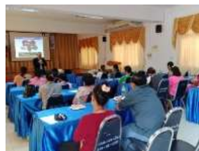
อบรมให้ความรู้เพิ่มศักยภาพในเรื่องสุขลักษณะของสถานที่เสสมอาหาร รวมถึงการขอรับใบอนุญาตประกอบการ การขอหนังสือรับรองการแจ้ง รวมถึงกฎหมายที่เกี่ยวข้อง