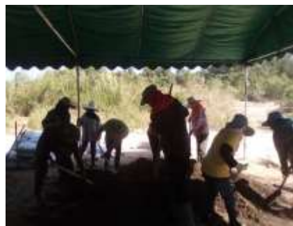
รณรงค์ทำปุ๋ยหมักใช้ในชุมชน ส่งเสริมให้ประชาชนในพื้นที่หลีกเลี่ยงการใช้สารเคมีทางการเกษตร