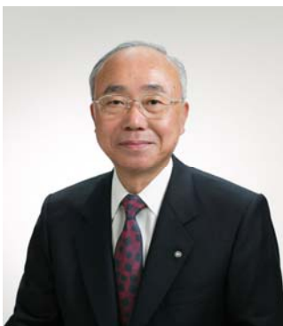
プログラムのリーダー：箕輪町長